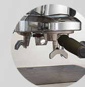
Portafilter PRESTIGE Siebträger PRESTIGE