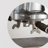
Portafilter PRESTIGE+ Siebträger PRESTIGE+

Beide Versionen sind mit dem einstellbaren Faema Heizsystem ausgerüstet. Aber nur PRESTIGE+ hat die praktischen und leicht zugänglichen Außenknöpfe am Tassenwärmer.