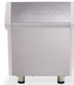
2 GROUPS 2 GRUPPEN